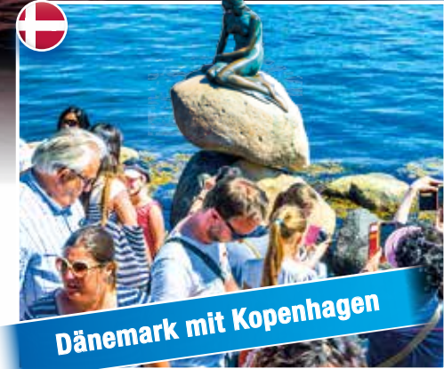
Dänemark mit Kopenhagen