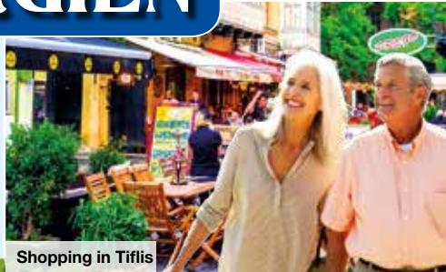
Shopping in Tiflis