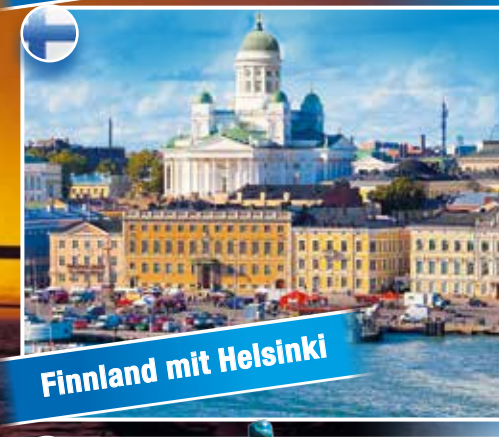
Finnland mit Helsinki