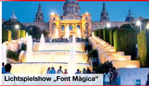
Lichtspielshow „Font Màgica“