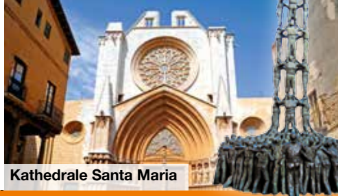
Kathedrale Santa Maria