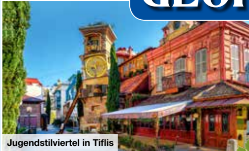
Jugendstilviertel in Tiflis