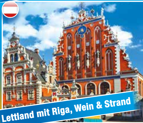
Lettland mit Riga, Wein & Strand