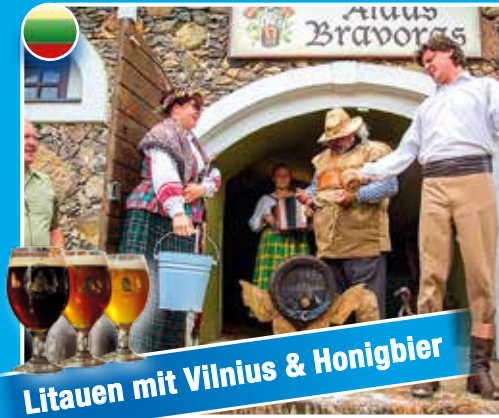
Litauen mit Vilnius & Honigbier