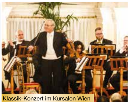
Klassik-Konzert im Kursalon Wien

Mit dem Fernreisebus fahren Sie heute nach Wien, wo Sie Ihr 4*-Hotel erwartet. Wir empfehlen Ihnen, vor Ort ein Paket bestehend aus zwei Abendessen zu buchen, das mit Erlebnissen wie Einkehr in einem „Heurigen“ und Prater-Besuch mit Riesenradfahrt gewürzt ist.