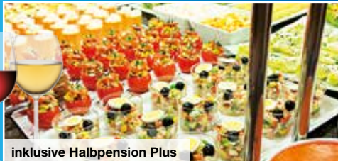
inklusive Halbpension Plus