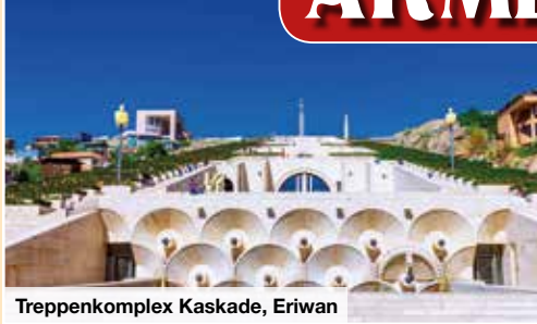
Treppenkomplex Kaskade, Eriwan