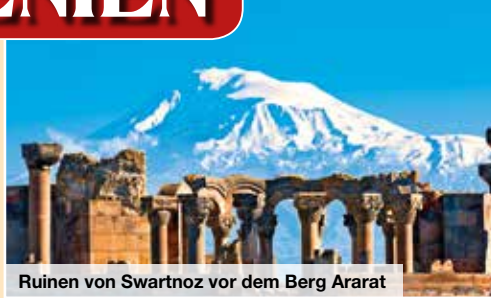
Ruinen von Swartnoz vor dem Berg Ararat