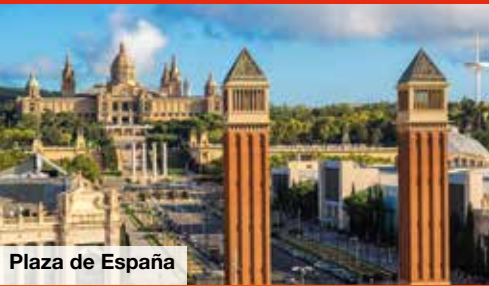
Plaza de España