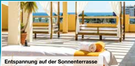
Entspannung auf der Sonnenterrasse