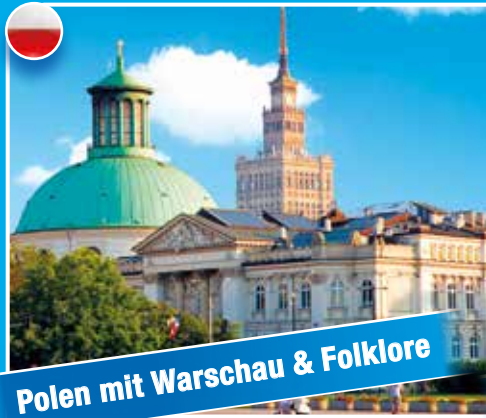
Polen mit Warschau & Folklore