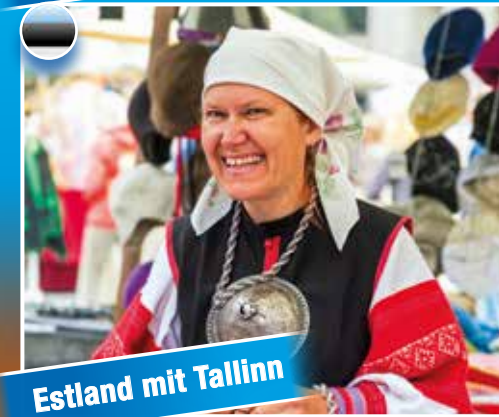
Estland mit Tallinn