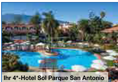
Ihr 4*-Hotel Sol Parque San Antonio

zubuchbaren Ausflügen können Sie die Schönheiten Teneriffas entdecken. Im Mittelpunkt dieser Tage steht aber Ihr Wohlbefinden: Sie genießen direkt in Ihrem Hotel 20 Kuranwendungen durch ausgebildete Masseure und Physiotherapeuten – das weckt neue Lebensgeister!